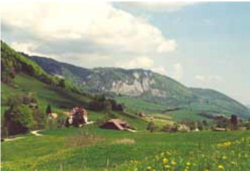
Blick auf die zweite Jurakette des "Thals". So schön kann Natur sein !