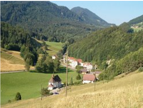
Region St. Joseph