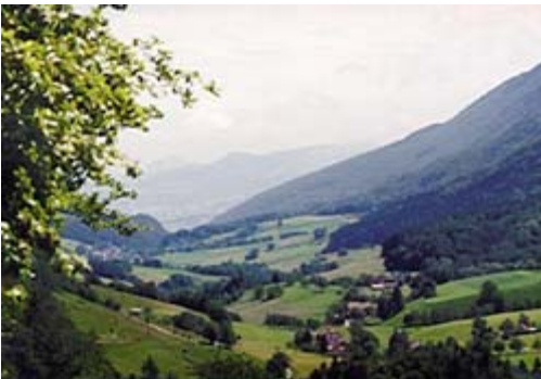
Gänsbrunn, ein Dorf im Grünen.